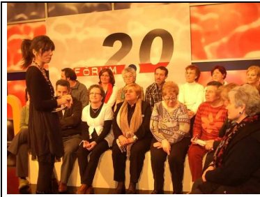
Debat 13: Perspectiva de gènere