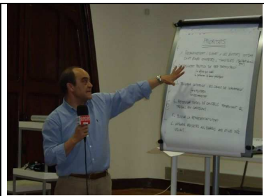
Sessions de treball (2 abril)