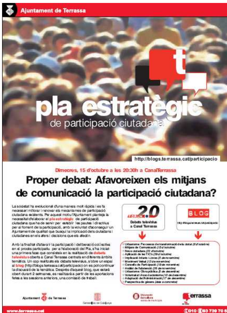
Anunci diari Avui+ (10/10/08)