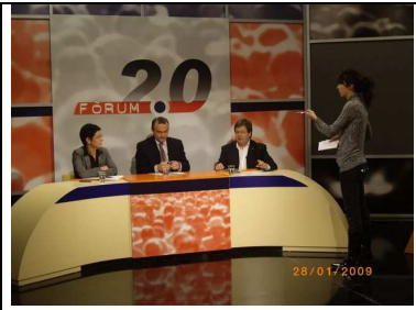
Debat 15: La iniciativa popular