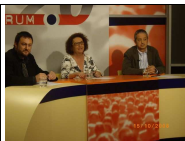
Debat 3: Mitjans de Comunicació