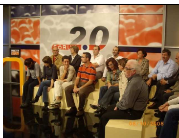
Debat 2: Urbanisme: Planificació i grans infraestructures