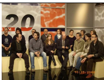
Debat 11: Adaptació de l'Administració