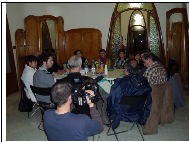
Sessions de treball (31 març)