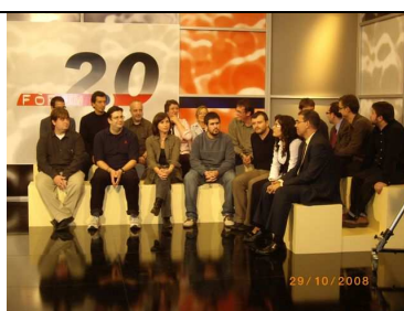
Debat 5: Aplicació de les TIC's