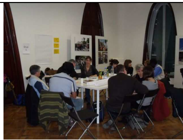
Sessions de treball (1 abril)