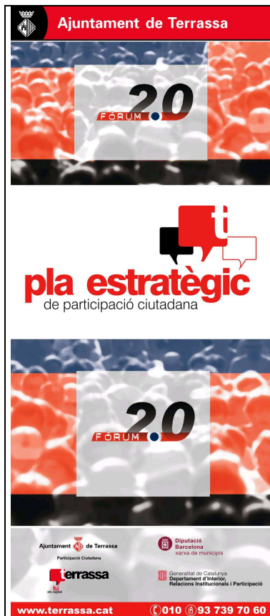
Flyer Fòrum 2.0