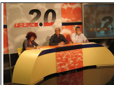
Debat 1: Processos de participació innovadors