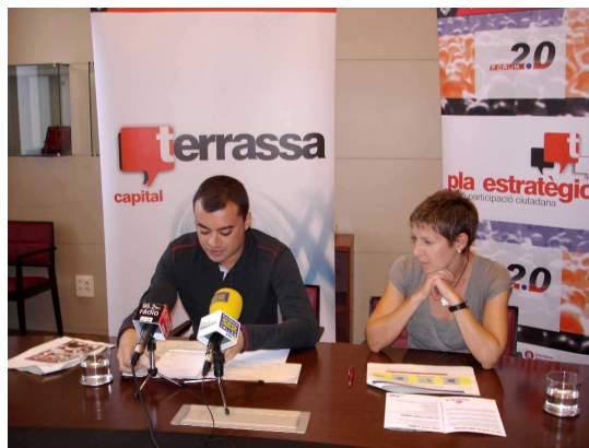
Roda de premsa de la presentació del procés