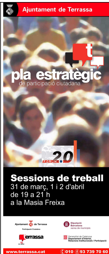
Flyer Sessions de treball