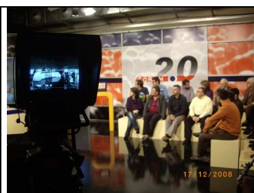
Debat 12: Voluntariat i Associacionisme