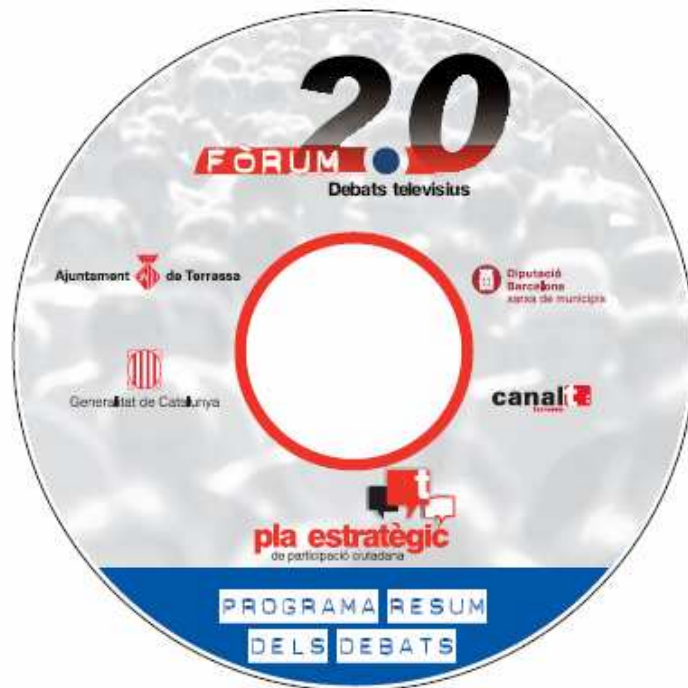
Caràtula DVD Programa resum dels debats televisius Fòrum 2.0