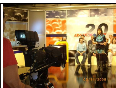
Debat 6: Implicació nens i joves