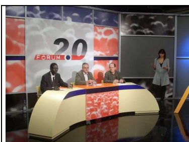
Debat 4: Nous ciutadans