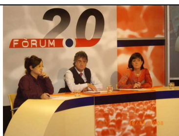
Debat 8: Consells de Participació