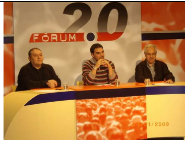
Debat 14: La Participació en els plans integrals