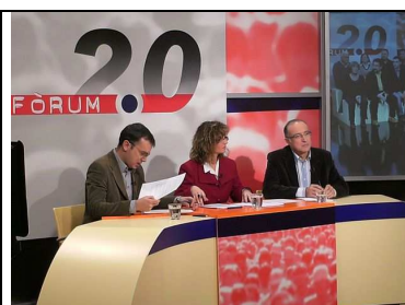
Debat 9: Anàlisi de l'abstenció