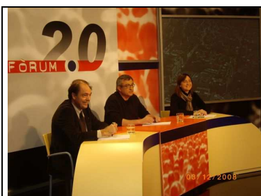
Debat 10: Urbanisme: Obra pública