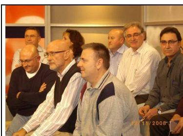
Debat 7: Moviment veïnal