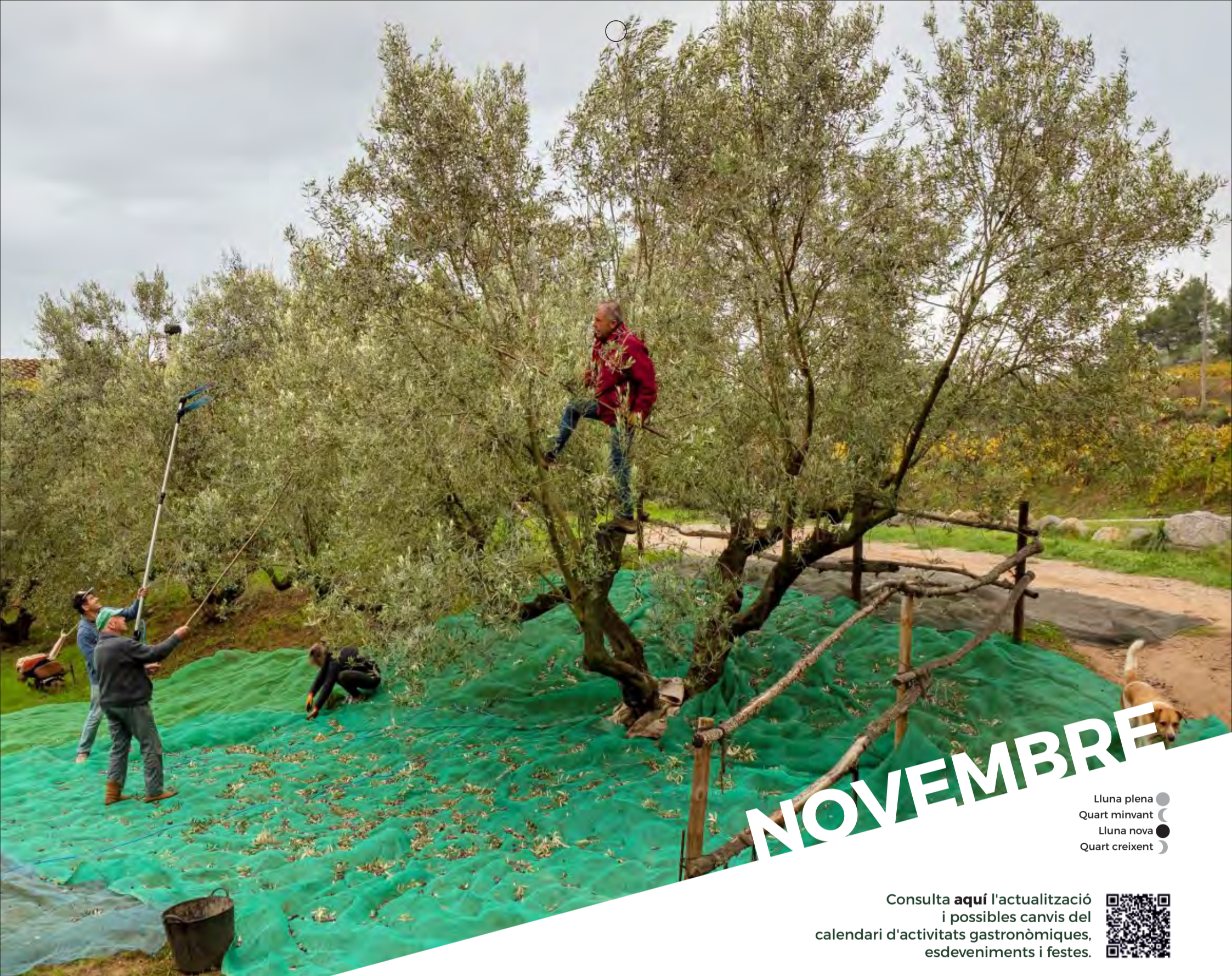
Collita d'olives - Can Morral del Molí