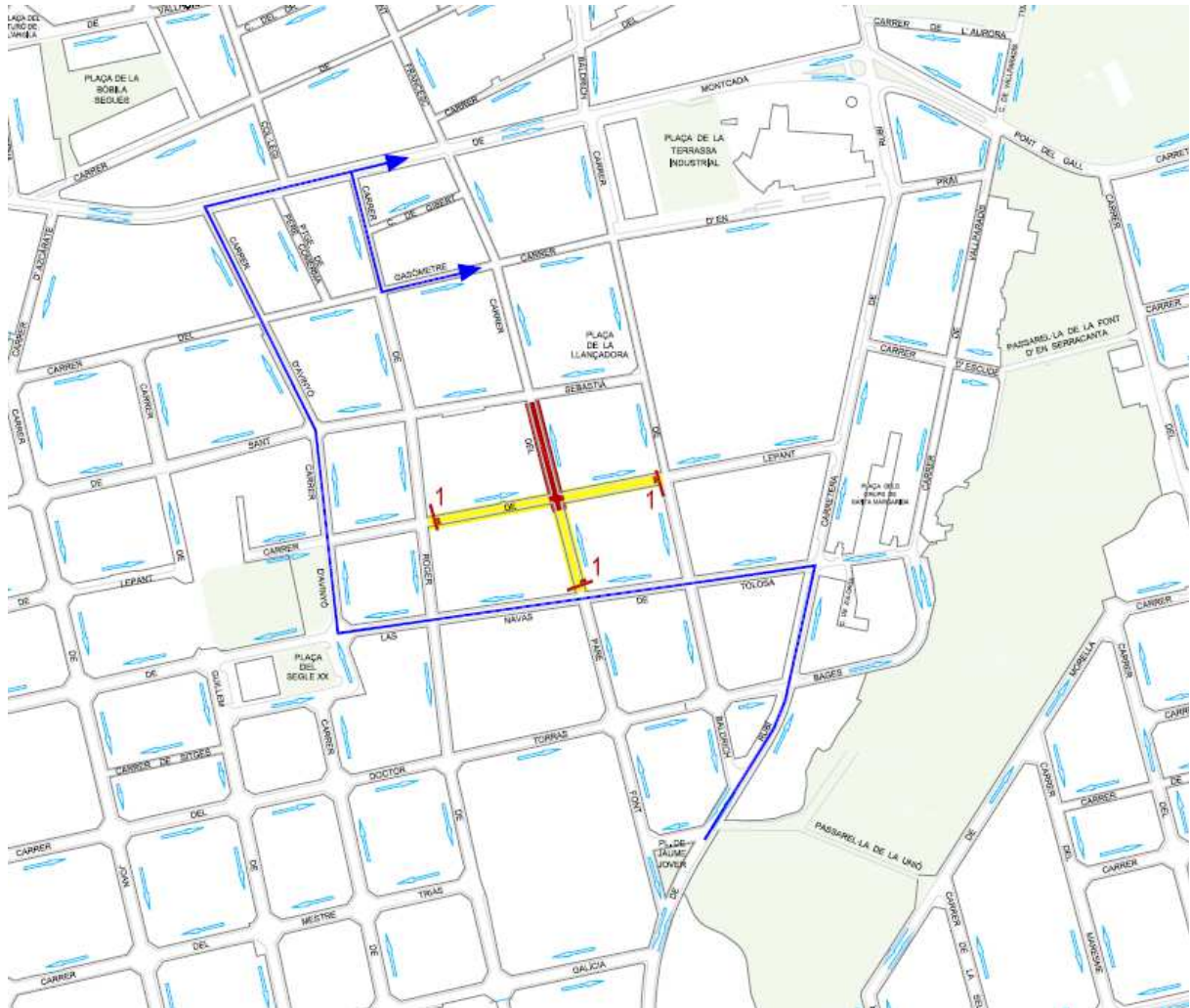
Talls de la segona fase (9 i 10 de febrer) i recorreguts alternatius